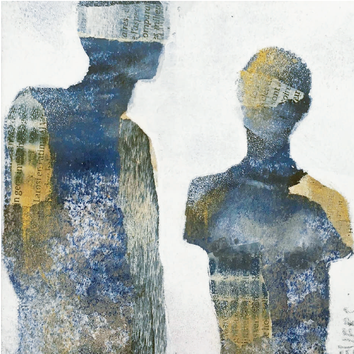
لوحة للرسماء الفرنسية المعاصرة: Evers