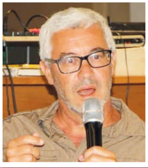
ترجمة عبد اللطيف شهيد

الأخر بالركض طلباً للمساعدة. أوماً الشاب برأسه بالإيجاب على مضض، واختفى في ظلام الليل. نظرت الفتاة في عيني الرجل القوي الذي حملها بين ذراعيه، همست بكلمة لم تصل شفيتها التي جرحهما البرد. شكرًا شكرًا.