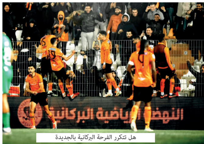
هل تكرر الفرحة البركانية بالجديدة