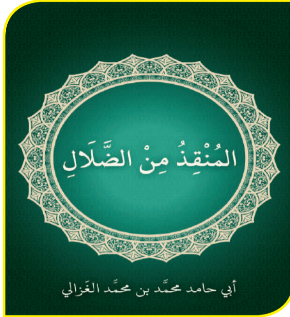
أبي حامد محمد بن محمد الغزالي

وقد حرص محققو كتب المحاسبي على التذكير بالوضعية الاجتماعية والثقافية في عصر المحاسبي، وذلك لمعرفة الظروف التي كانت مؤثرة في الحياة الثقافية، والتي كانت تدفع إلى هذا النوع أو ذلك من السلوك ومن هناك نشأ وتشعب منهاج ومنشأ التصوف والمتصوفة. وهذا يدفع للسؤال حول من هم تلاميذ المحاسبي؟ وما علاقته بالإمام الجنيدي؟