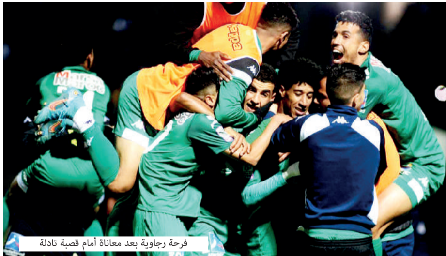
فرحة رجالية بعد معاناة أمام قسبة تادلة