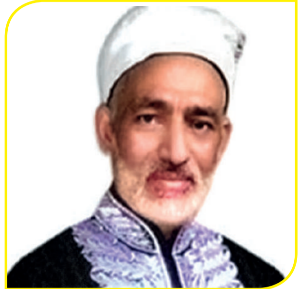
الشيخ حسين مخلوف

إن المحاسبي بعد هذا البحث عن الطريق وجد أن الإجماع على أن الكتاب والسنة عليها المعول في معرفة الفرائض والسنن، ولكن وجد أن الفقهاء ليسوا على رأي واحد فهم يختلفون ويتفقون، ولكنه وجد أن من بينهم من يرتاح لعلمه وصدقه، وبدأ يبحث من بين الناس عن هذا الصنف ولكنه كما قال «فعمظمت مصيبتني