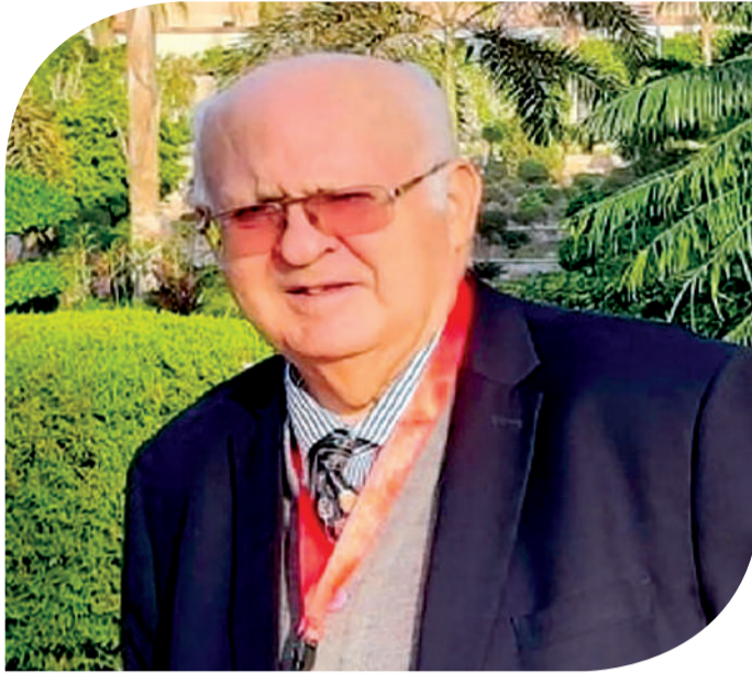
عبد القادر الإدريسي

هذا سؤال أطرحه ولست معنياً بالبحث عن جواب عنه. وحسبي أن أقول إن الإعلانات والبيانات التي تصدر عن منظمة التعاون الإسلامي لا تخلو