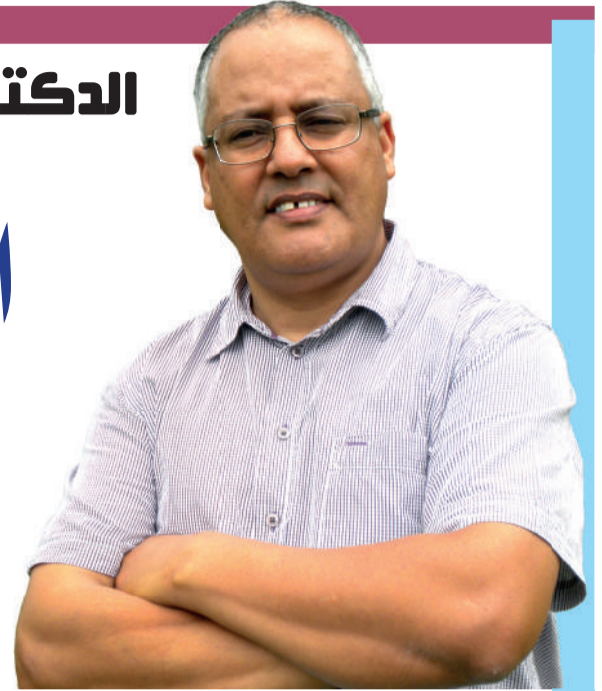
حاورته زهرة العسلي

بين بشر من لحم ودم، وليس على أوراق ومذكرات تدرس في مكاتب البحث فقط.