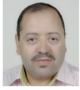
إعداد: إسماعيل أزيات

نفسه ضحك كثيرا عندما كتبها. طبعاً، عندما قرأنا هذه القطعة، أخذنا نقرأ المنفلوطي أي أخذنا نقرأ خارج المدرسة، نقرأ نصوصاً من دون مراقبة المدرس. قرأت كل ما كتب المنفلوطي في ذلك الوقت، وأظن أنني تعلمت الكتابة الأدبية على يده. هنا أخطب الجيل الجديد: لا تتصورون المكانة التي كانت للمنفلوطي في العالم العربي قبل خمسين سنة.