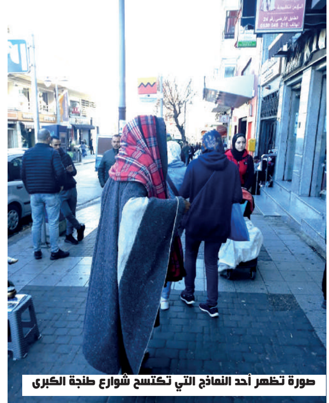
صورة تظهر أحد النماذج التي تكتسح شوارع طنجة الكبرى

من المظاهر المشينة، والمستهجنة، والمذلة، والمدنسة للكرامة الإنسانية، والتي أصبحت شبه دائمة بشوارع وساحات مدينة (طنجة الكبرى)... وهي التسول باستعراض العاهات الجسدية المقزرة، والتسول (التقليدي) باستغلال الأطفال الرضع، والضري، والمقعدين، والمسنين، والمدمنين.. مع بروز ظاهرة اختفاء، وعودة المتسولين الفارين من اخواتنا واخواننا من دول جنوب الصحراء الذين يضعون أرواحهم الرخيصة في قبضة شبكات الإتجار في البشر، مقابل العبور الغادر، عبر (مقبرة) الفرق في البوغاز أو البوران... تتسائل ضمائرنا عما نحن فاعلوه..