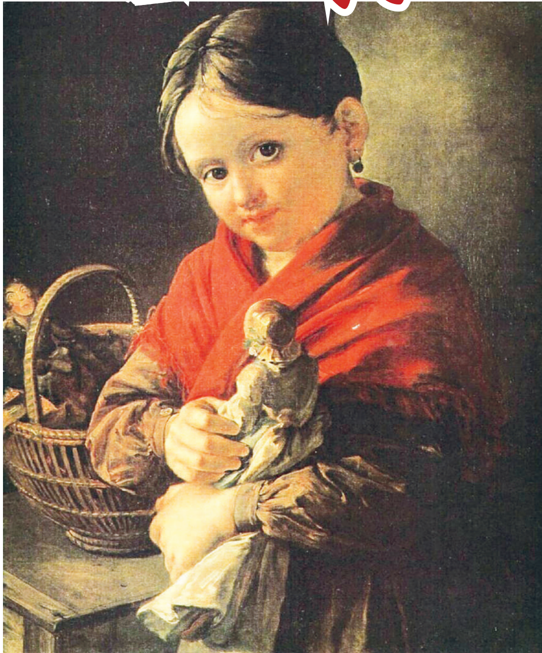
«فتاة مع دمى» للرسام الروسي فاسيلي ترويينين