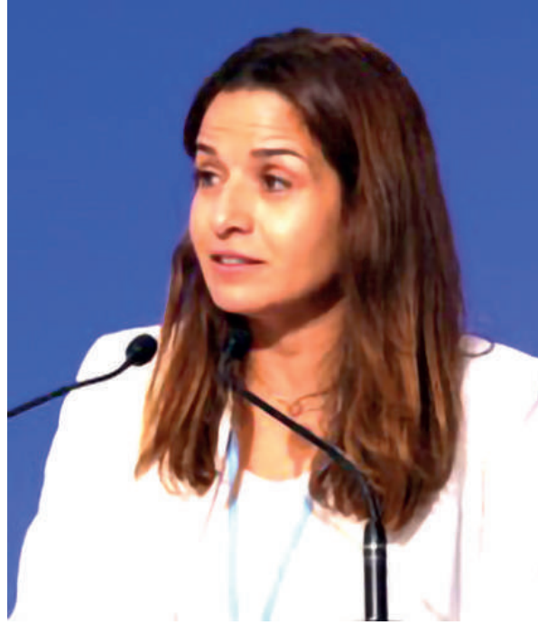
بنعلي فإننا نشغل على مستوى ثلاثة ورشات متوازنة البنية التحتية، وعقود شراء الغاز، والإطار التشريعي.

ولضمان إمداد بلادنا بما يلزم من الغاز الطبيعي، تقول الوزيرة لبي