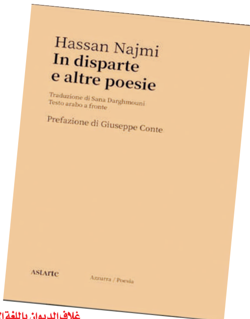
غلاف الديوان باللغة الإيطالية

جسر متين وشجاع أيضاً، سواء على مستوى الأسلوب أو على مستوى مثالي، بحيث يربط الثقافة العربية بالثقافة الغربية بأحسن الطرق ونحن في حاجة إلى جسور مثل هذه، من البداية، من اقتباس أنغاري، أكثر الشعراء الإيطاليين المخضرمين والوحيد الذي تأثر بصوت المؤذن والذي سبق لي أن لاحظت تأثيره في كتاب سابق لحسن نجمي، ومن الإهداء إلى أحماتوفا، الشاعرة الروسية العظيمة، نفهم أن الكاتب ينوي إجراء حوار واسع النطاق مع الثقافة الغربية، وتولد قصيدة من زيارة إلى مقبرة في برلين حيث يوجد قبر بين العشب الصامت والهادئ الجليل ربما هو قبر أعظم كاتب ألماني في القرن العشرين: «هُوَ ذَا سُبْتَمْبَرِ