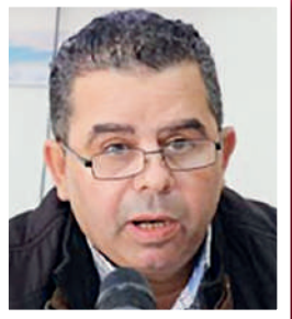
ترجمة: مراد الخطيبي