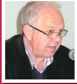
ترجمة: عبد السلام مصباح