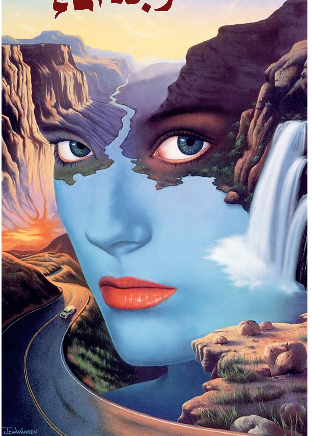
لوحة للرسام الأمريكي جيم وارن - Jim Warren

يَدِي فِي يَدِهِ يَجْرُنِي نَحْوِ زَوَابِعِهِ أَنْى حَلَّتْ يَتَدَثَّرُ بِأَهَابِ بُوْحِي مِثْلَ سَاحِرٍ صَغِيرٍ يُخْرِجُ كُلَّ يَوْمٍ مِنْ قَبْعَتِهِ أَشْيَاءَ وَأَشْيَاءَ .