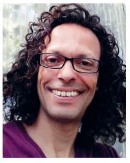
احسان بن زبير