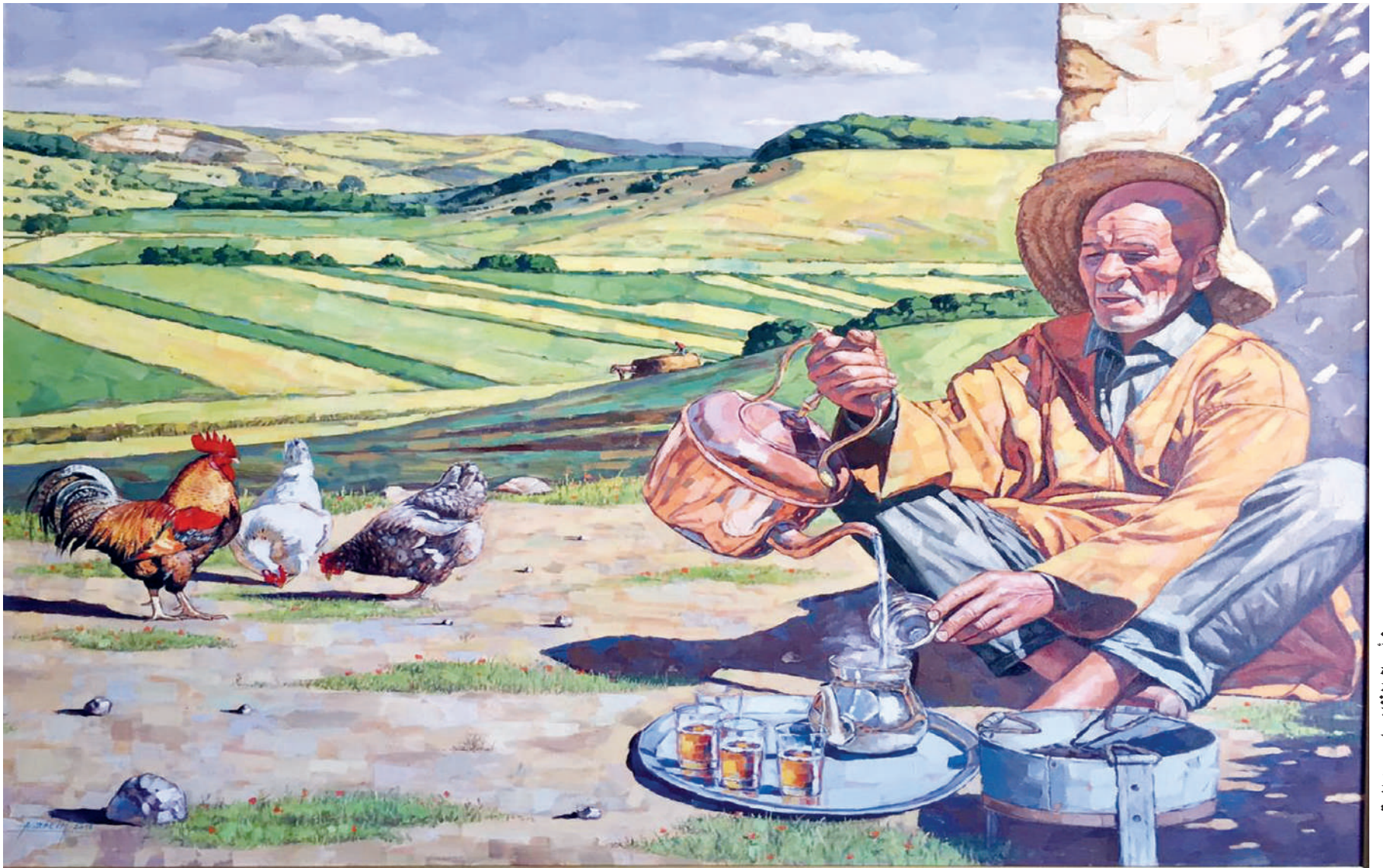
من أعمال الفنان سليم عبد الحق