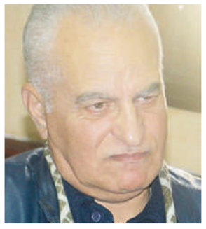
حوار وترجمة: محمد معطيم