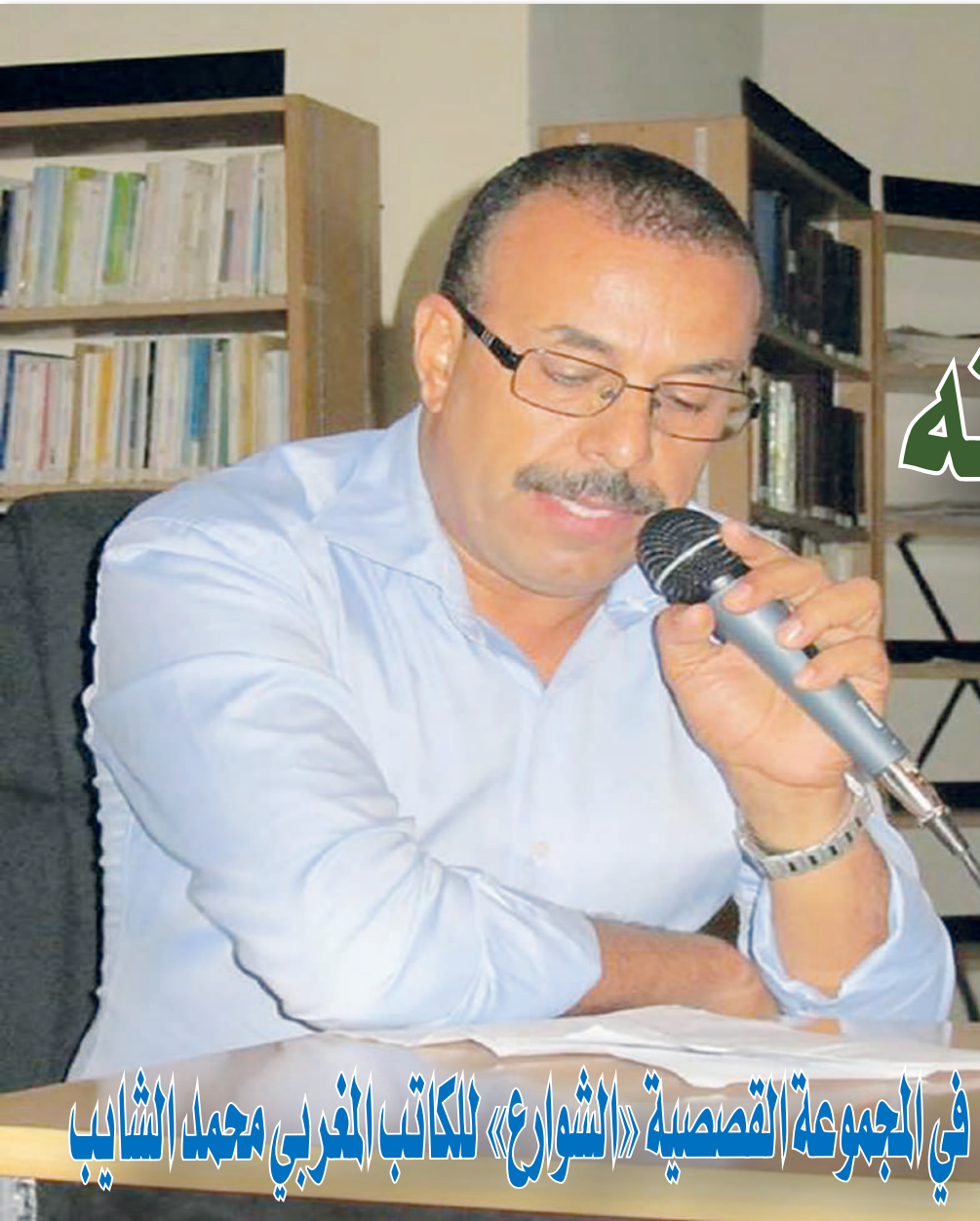
في المجموعة القصصية «الشوارع» للكاتب المغربي محمد الشايب

مفرده شارع، الجمع: شوارع، مشرعون شُرْع، اسم فاعل من شَرَع، والشَّارِعُ في الشيء: البادئ فيه، الشَّارِعُ؛