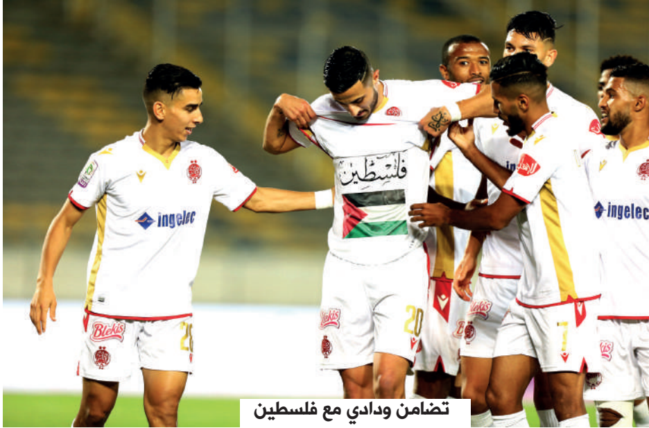
تضامن وندائي مع فلسطين