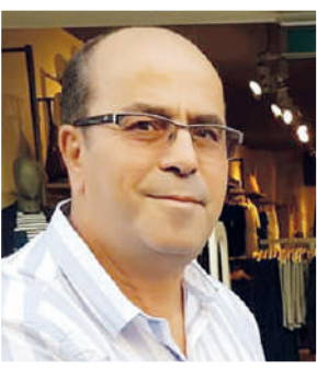
عبد العزيز امريان