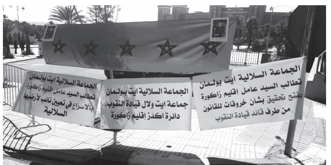
الجماعة السلاوية آيت بولمان

في تحد سافر وخرق لقانون حالة الطوارئ الصحية وحظر التنقل الليلي، صمم مجموعة من القاصرين والمراهقين ليلة الاثنين 19 أبريل 2021 على خلق الفوضى وبيت الرعب في صفوف المواطنين، وخاصة أصحاب السيارات والشاحنات والدرجات النارية من خلال رشقهم بالحجارة، بالإضافة إلى أنهم قاموا بإضرام النار بالعجلات والإطارات المطاطية بطريق ابن أحمد الرابطة بين سطات ورأس العين على مستوى إقامة غزلان المعروفة بـ«الفاسي»، مما تسبب للاسكنة المجاورة في حالة من الذعر والقلق. وعائنت جريدة «العلم» عن قرب سلوكيات مشيئة وتصرفات غير قانونية من لدن مجموعة من القاصرين الذين حولوا الطريق المذكورة إلى ساحة حرب بإضرامهم النار، وحرك السير بسبب لعب النيران والدخان الكثيف الذي لوث المحيط المجاور، وعدم القدرة على التنفس خصوصا لدى