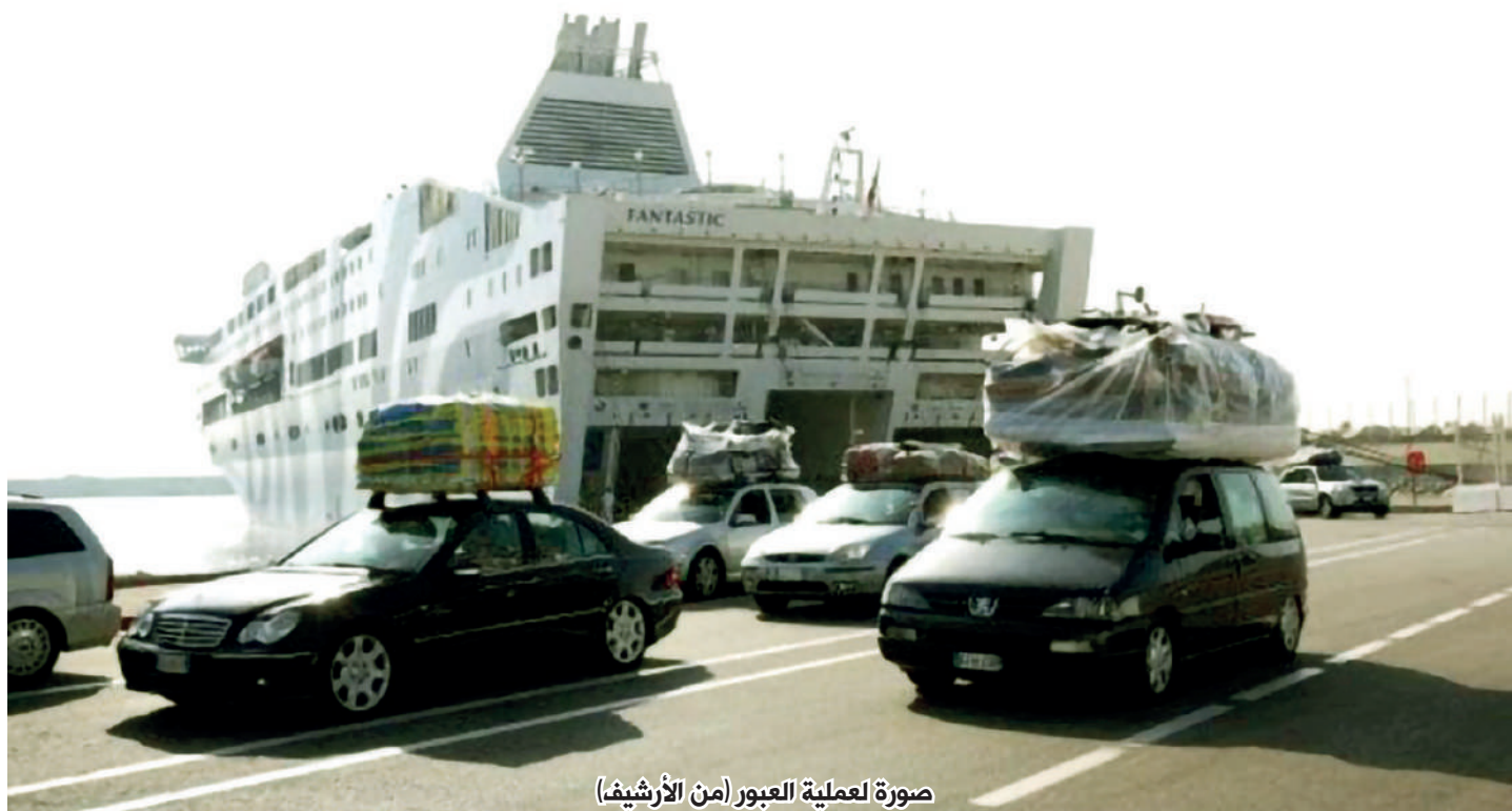
صورة لعملية العبور (من الأرشيف)

ما تتطلب عملية عبور 2021 من استقبال، وانتظار وخدمات وعبور بواسطة الواصل الإسباني، الرابطة ما بين الجزيرة الخضراء والميناء المتوسطي، وطنجة المدينة، وما بين الجزيرة الخضراء وسبتة السليبية، وما بين طنجة المدينة، وما بين الميريا، ومالقة والنابور والحسيمة... أي أن إسبانيا جاهزة كالعادة، ما بين 15 يونيو، و 15 سبتمبر من سنة 2021 الجاري. و يبقى السؤال العريض، مطروح على السلطات المغربية المعنية، وبالدرجة الأولى وزارة الخارجية التي لها صلاحيات اتخاذ القرارات الملزمة كما تم ذلك في الموسم المنصرم.