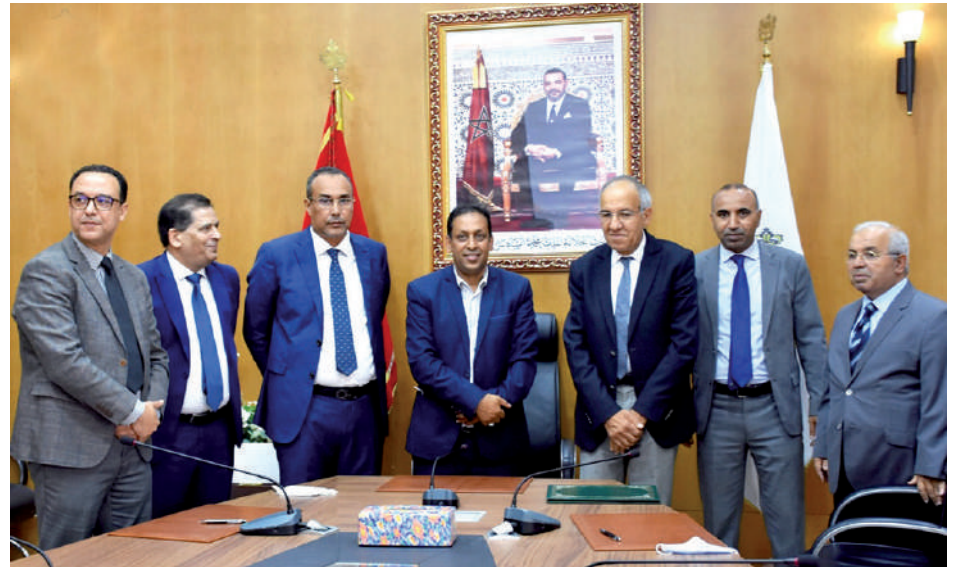
الداخلة - العلم